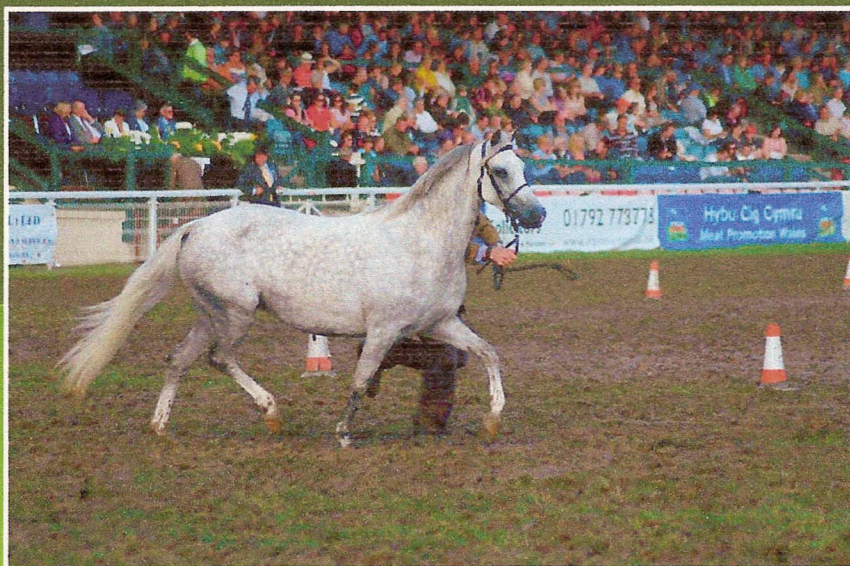
MILLCROFT LOTUS