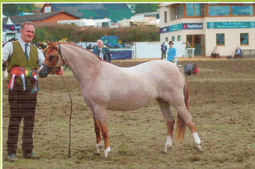
PADDOCK ALESHA